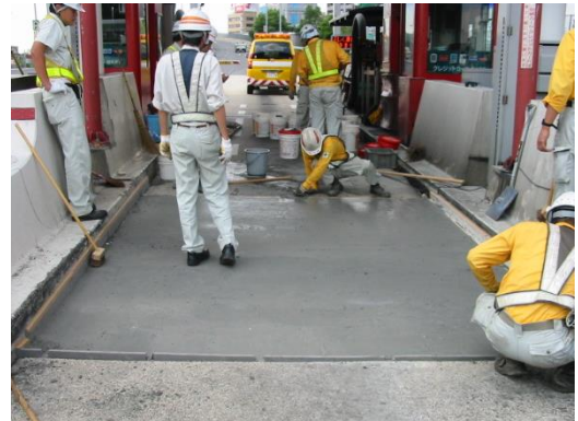
E T Cレーン段差解消補修