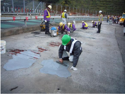
舗装やり替え工事での床版補修