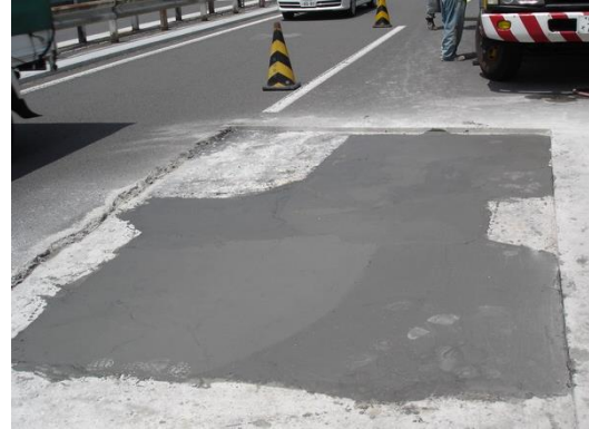
道路橋床版の緊急補修