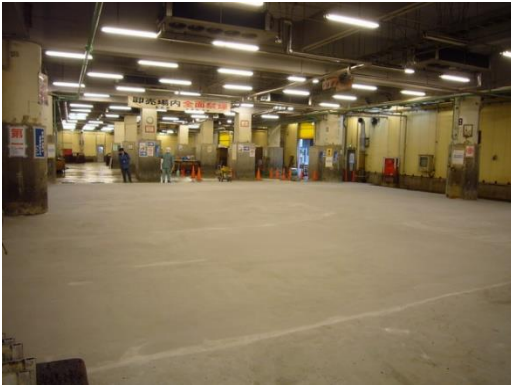
卸売り市場床面全面オーバーレイ改修