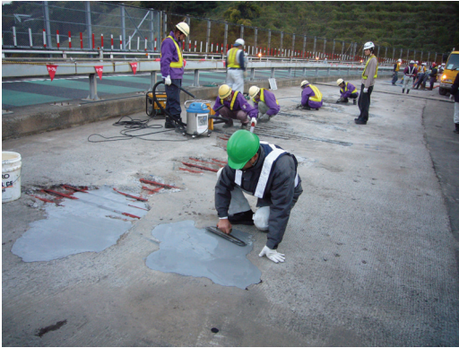
舗装やり替え工事での床版補修