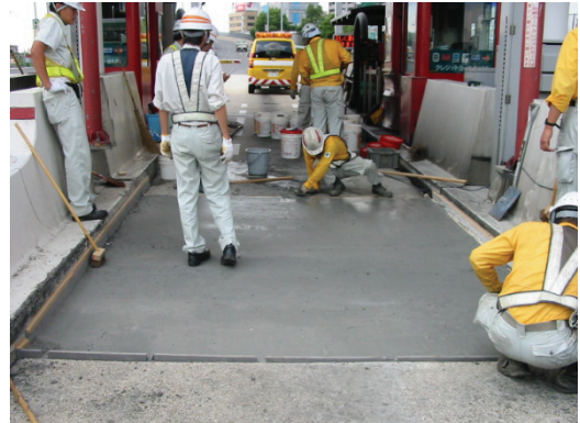
ETCレーン段差解消補修