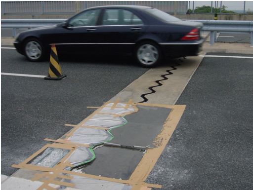
ジョイント後打ち部の緊急補修