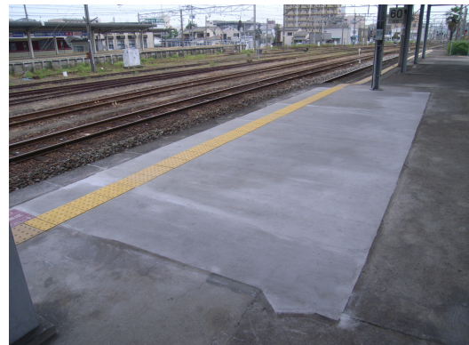
鉄道プラットフォームの補修