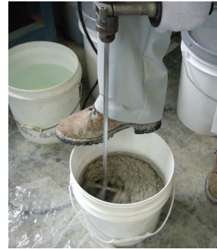
ハンドミキサーでの練混ぜ