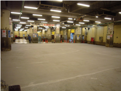
卸売り市場床面全面オーバーレイ改修