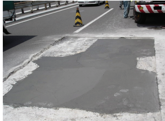
道路橋床版の緊急補修